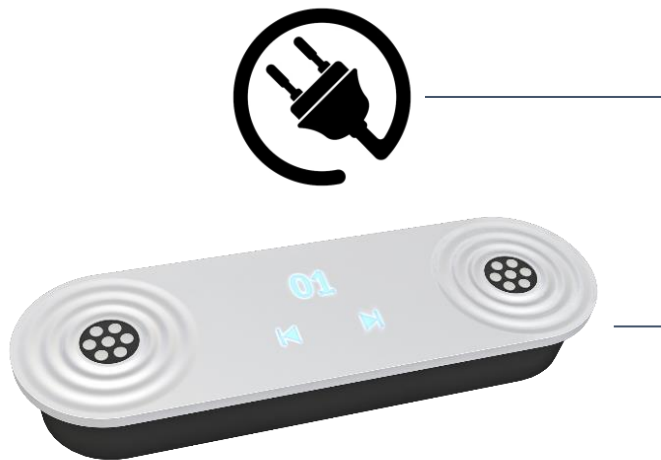
Hörstation « Akku »